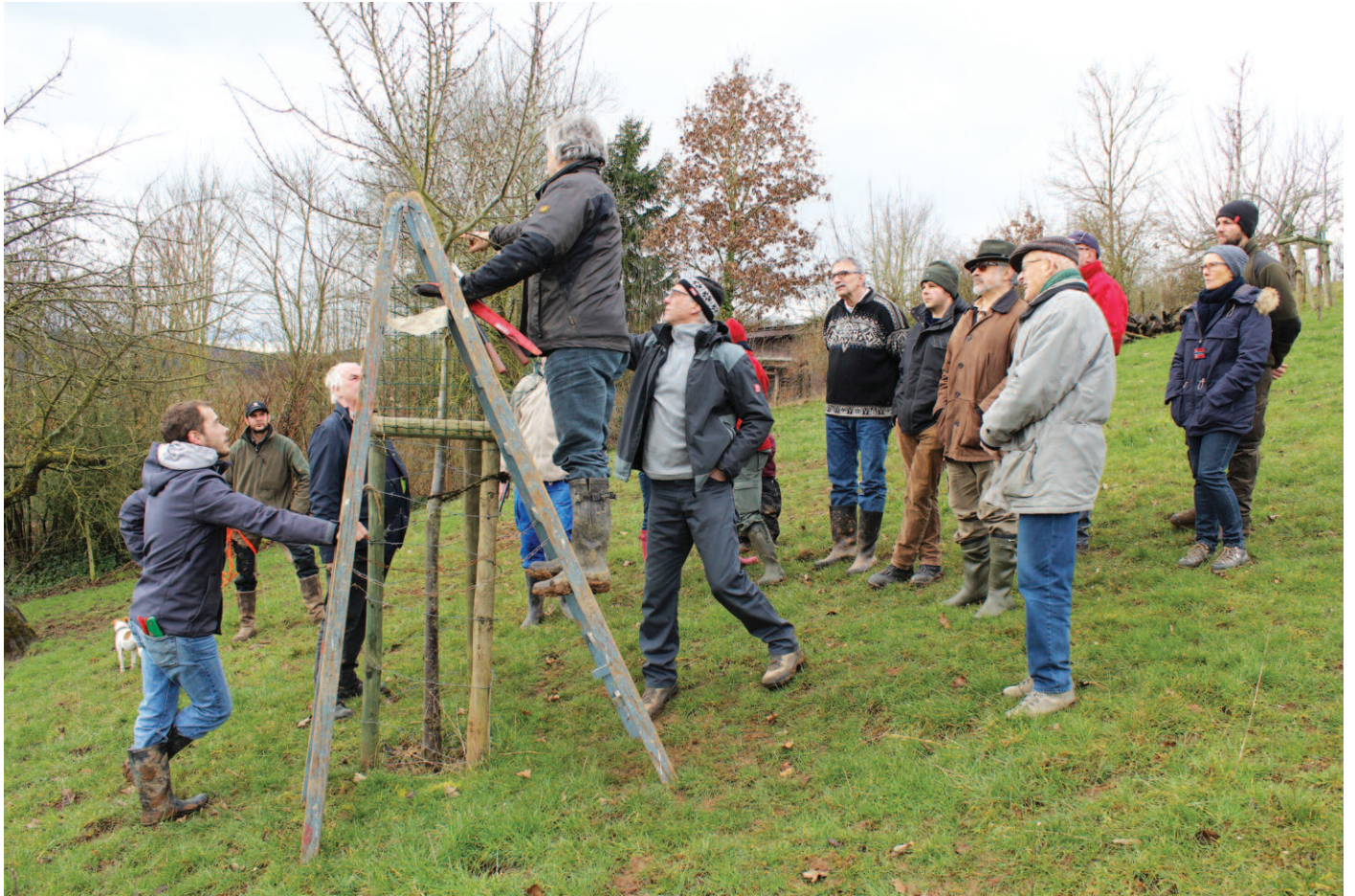
Baumschnittkurs und Baumpflanzaktion