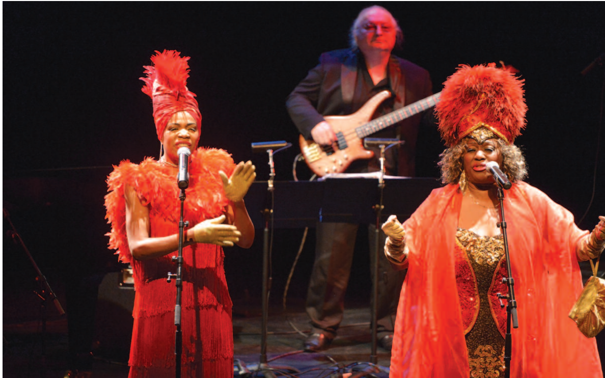
Three Ladies of Blues