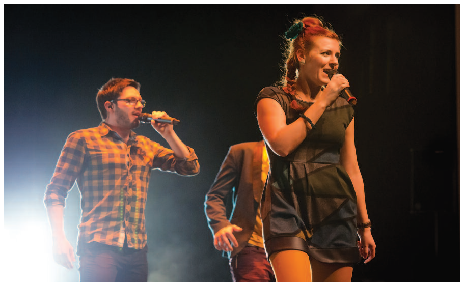
Cape Unduzo >

Mit der Saison 2015-16 feierte das CAPE - Centre des Arts Pluriels Ettelbruck sein 15. Jubiläum unter anderem mit einem neuen Design, einem abwechslungsreichen Programm und vielen spannenden und mitreißenden Veranstaltungen für Groß und Klein.