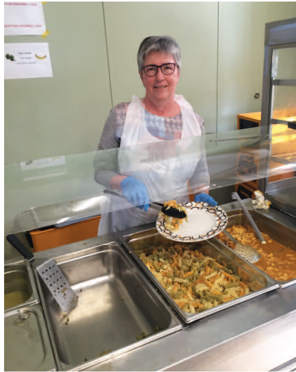
Foyer des Réfugiés à Ettelbruck

Depuis l'annonce de l'arrivée des réfugiés dans notre pays, j'avais le désir de m'engager à leur côté et de montrer ainsi un peu d'humanité à leur égard. Le grand groupe de la paroisse m'offrait la chance d'un engagement concret. Pour ma part, je sers le repas de midi du mercredi, et, le jeudi entre 15h30 et 17h, j'organise des jeux de société pour enfants et adultes. C'est très amusant, parce que les gens arrivent et partent comme ils veulent. Il faudrait plus de jeux pour les satisfaire tous. Ces deux activités me permettent de parler avec les réfugiés et de les reconnaître