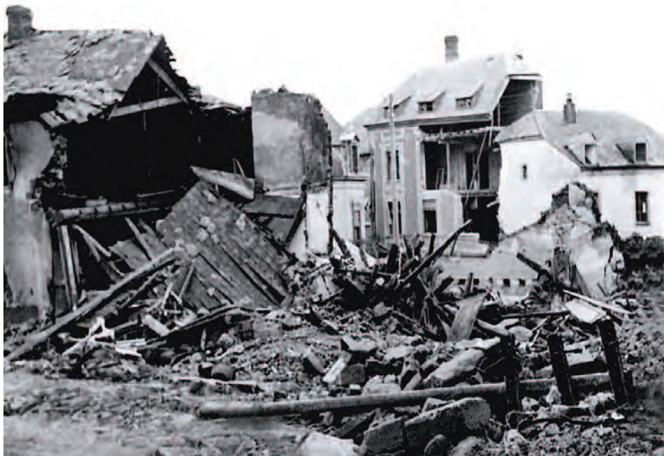
L'«Äschenhiwwel» (colline de cendres) après l'offensive des Ardennes en 1945