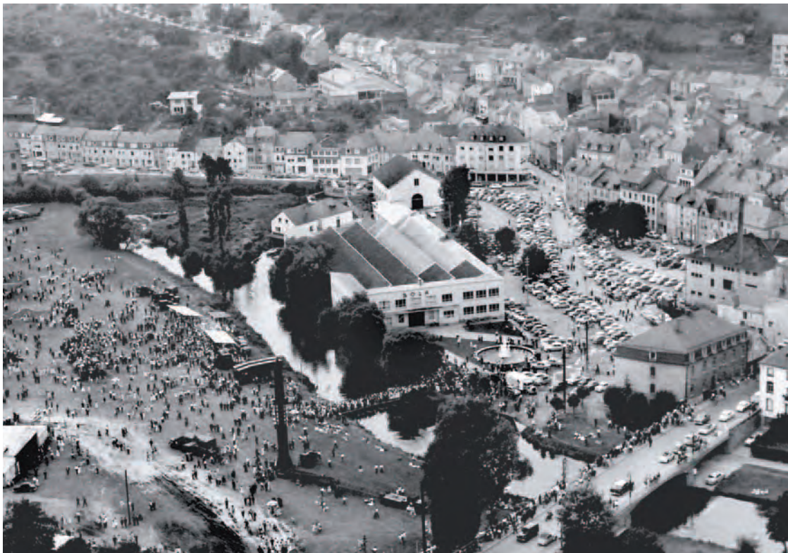
Der Marktplatz und seine Umgebung im Jahre 1959