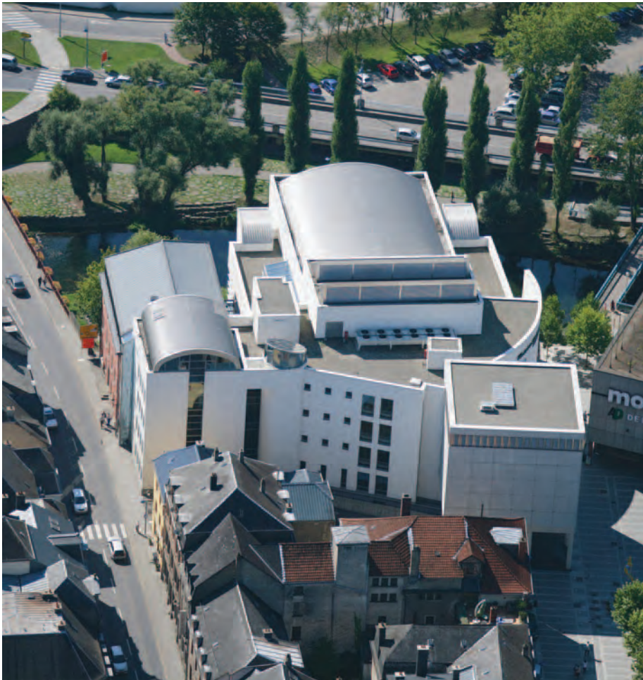
Das „Centre des Arts Pluriels Ed. Juncker“ aus der Vogelperspektive