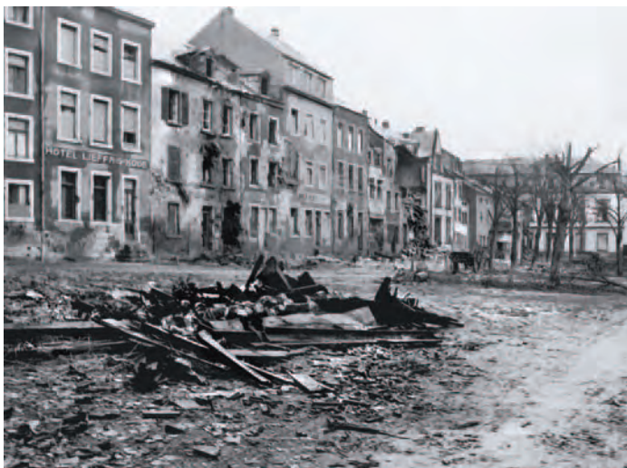
Der Marktplatz nach der Ardennenoffensive 1945

Ettelbrück vers 1898 avec la draperie Godchaux au premier plan