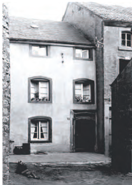
Une maison typique construite vers 1761 dans la rue Neuve