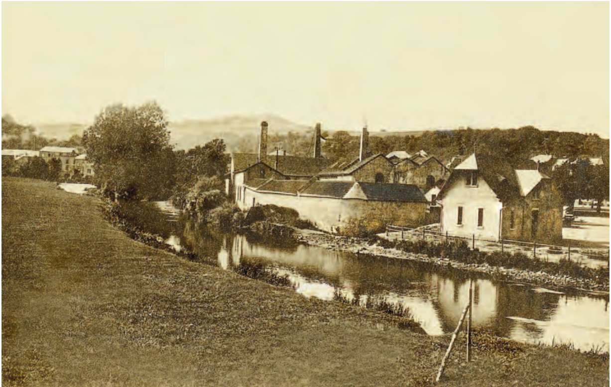
Die Tuchfabrik und der 1906 errichtete Feuerwehrturm von der Alzettebrücke aus gesehen

La draperie et le bâtiment des sapeurs-pompiers de 1906 vus depuis le pont de l'Alzette