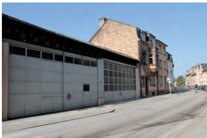
43-47, rue de Warken