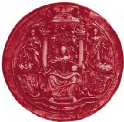
Le sceau de l'impératrice apposé au décret concernant le marché