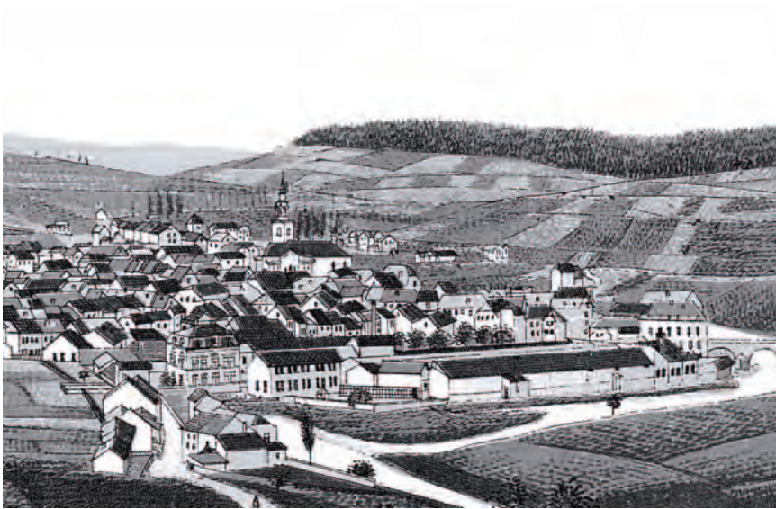
Ettelbrück um 1898 mit der Tuchfabrik Godchaux im Vordergrund

Ettelbrück vers 1898 avec la draperie Godchaux au premier plan