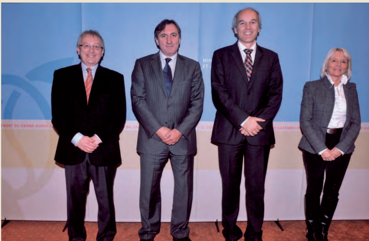
Assermentation du Collège Echevinal de la Ville d'Ettelbruck au Ministère de l'Intérieur et à la Grande Région