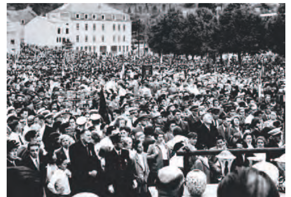
Die Jahrhundertfeier der „Philharmonie Grand-Ducale et Municipale“ im Jahre 1952

In der Villa Godchaux, ehemaliger Wohnsitz der Fabrikherren, war von 1911-1914 das erste Krankenhaus der Stadt, die „Clinique Saint-Joseph“ untergebracht. Zum Schluss des Ersten Weltkrieges diente es verletzten jüdischen Frontkämpfern der deutschen Armee als Genesungsheim. Die Villa selbst wurde unmittelbar nach dem Zweiten Weltkrieg abgerissen.