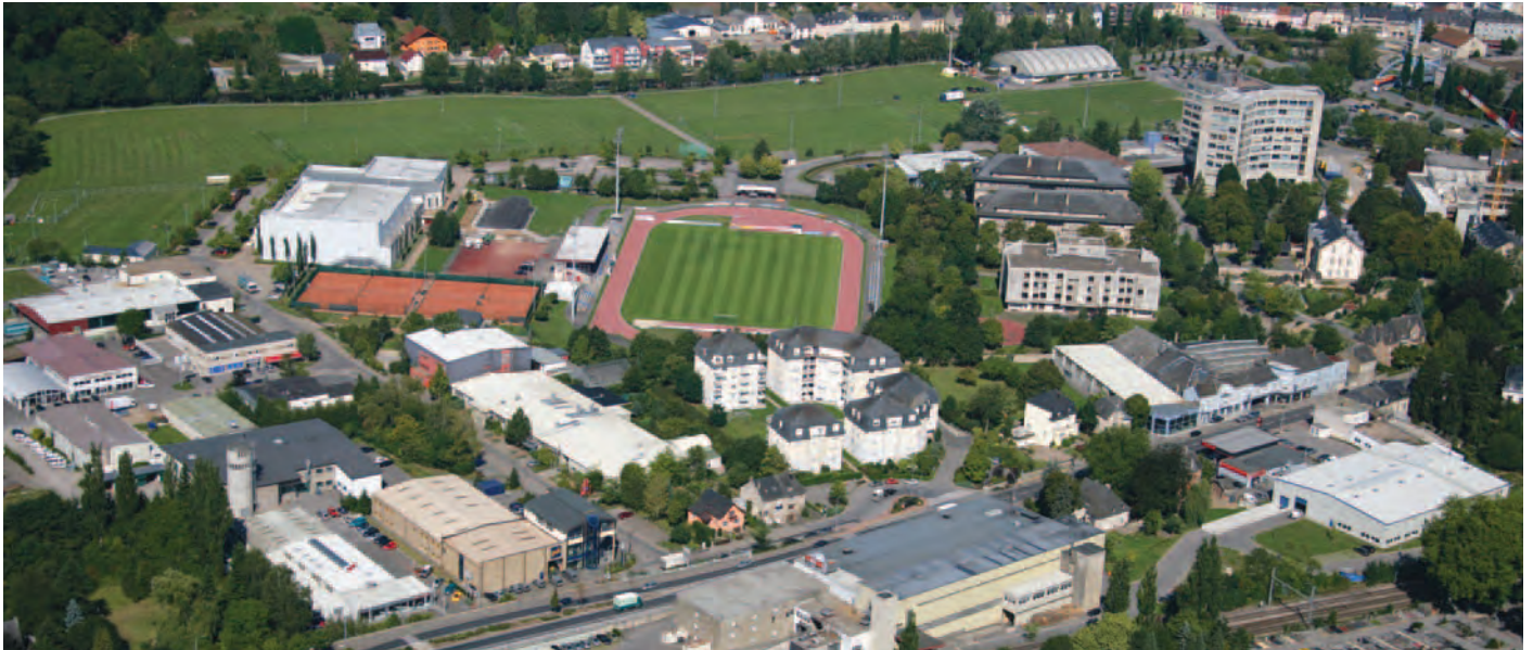
Das Deichgelände mit seinen Infrastrukturen