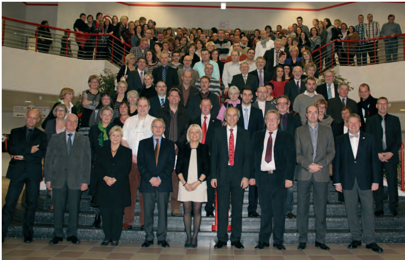
Fête de fin d'année 2011 du personnel de la commune d'Ettelbruck