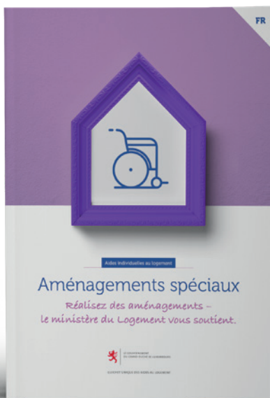
Aides individuelles pour aménagements spéciaux