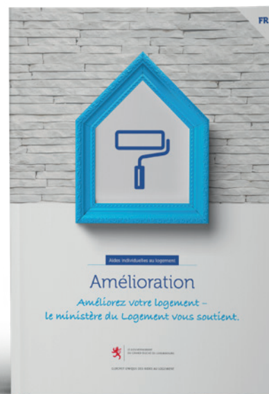
Aides individuelles pour l'amélioration