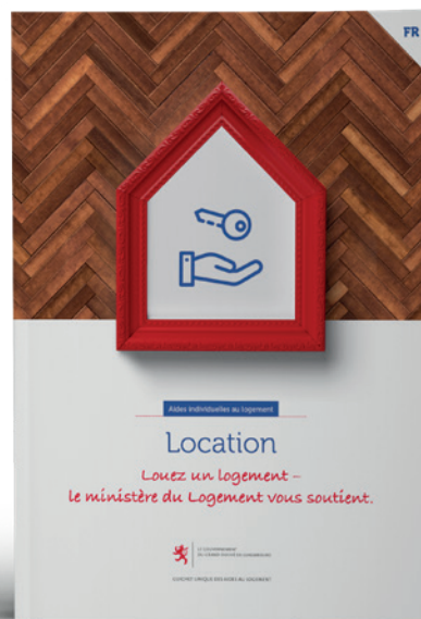
Aides individuelles pour la location