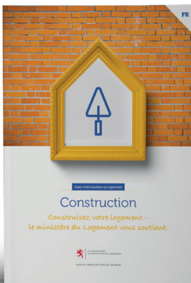
Aides individuelles pour la construction

Si vous souhaitez construire, acquérir, améliorer ou aménager spécialement un logement, d'autres aides sont susceptibles de vous intéresser sur logement.lu