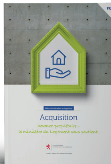
Aides individuelles pour l'acquisition