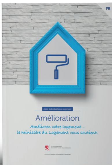
Aides individuelles pour l'amélioration