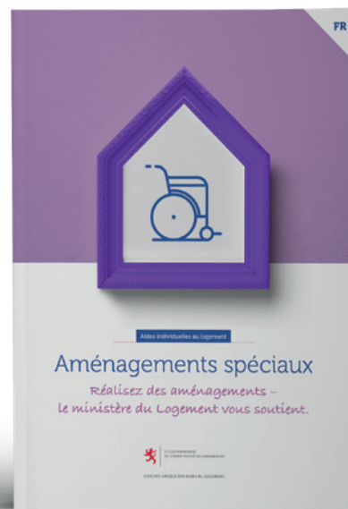
Aides individuelles pour aménagements spéciaux